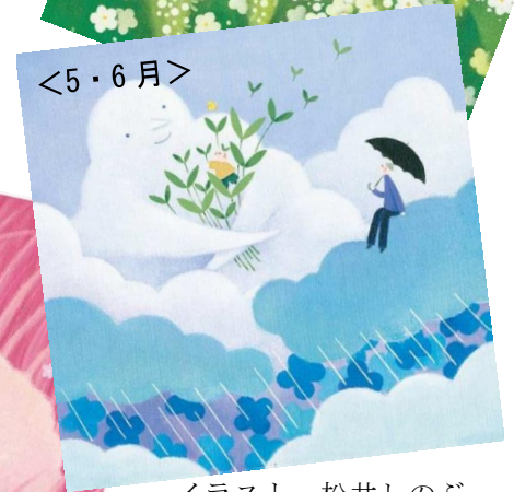
イラスト 松井しのぶ