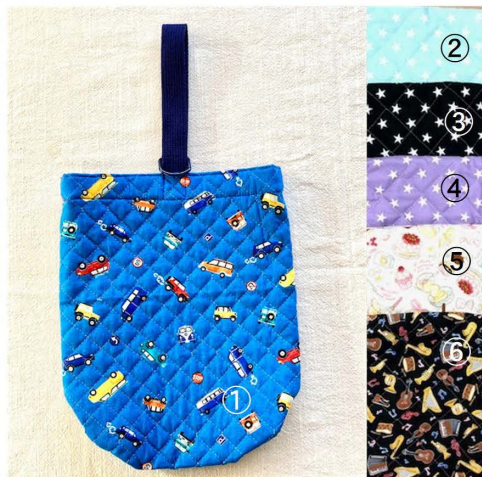
シューズバッグ 1800円