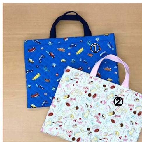
レッスンバッグ 2800円